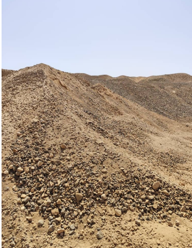
خليط أساس للطرق Primer mixture for roads