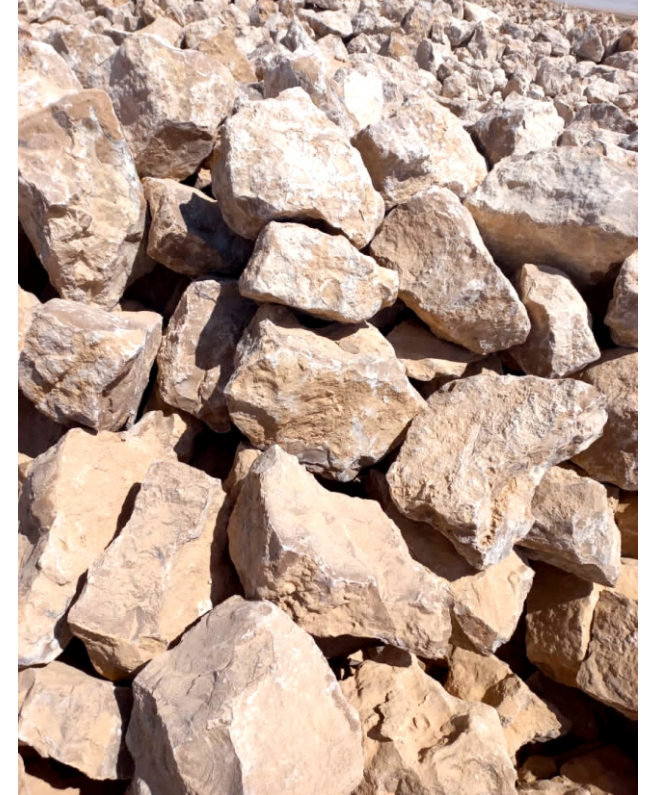
صخور بأحجام حسب الطلب Customized cupping rocks